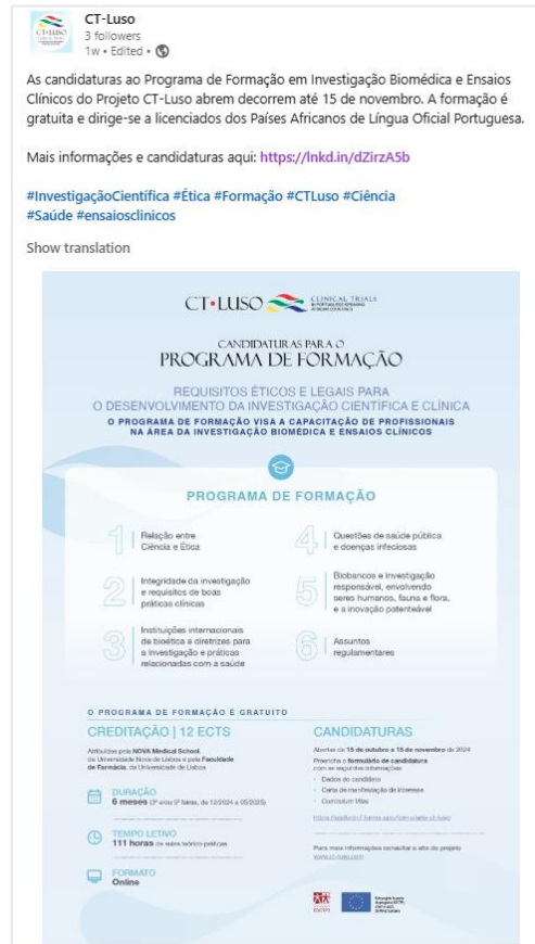
Figure 3 - Post about the Work Package 4 training program

The LinkedIn page will be updated regularly with new publications. These updates will highlight news and issues of interest to our partners. For example, Figure 3 illustrates a publication related to the Work Package 4 training program, which includes details about the application process and relevant links.